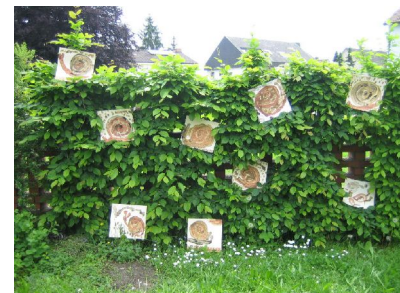
Projekt: Von Stadtkindern zu Erdlingen Sommer 2006