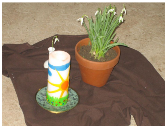
Religiöse Erziehung: Betrachtung eines Schneeglöckchens

Um 16.15 Uhr endet dann auch für diese Kinder ein langer Kindergarten tag.