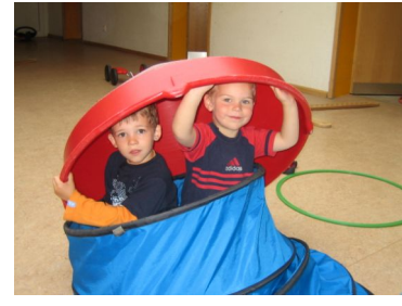
Spiel in der Halle

Der Kindergarten St. Michael ist eine moderne Einrichtung, die mit einem Team von 12 Erzieherinnen 83 Kinder betreut.